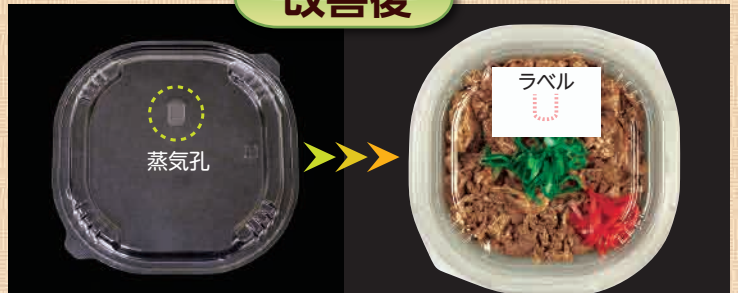
蒸気孔の位置を移動! ラベルが中心からズレ、中身がよく見える!