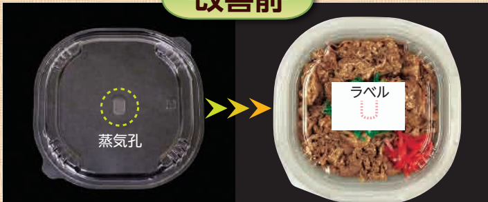
蓋の中央に空けられた蒸気孔 ラベルで覆うと中身が見えづらい