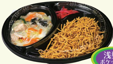
餡かけかた焼きそば