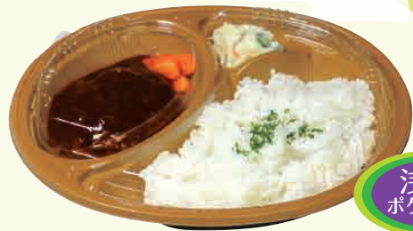
煮込みハンバーグ