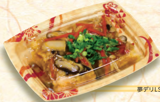
まりはなび 夢デリLS 10【鞠花白】