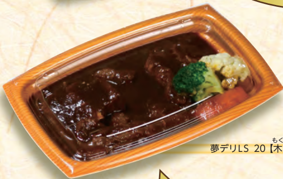
もくめしん 夢デリLS 20【木目新】