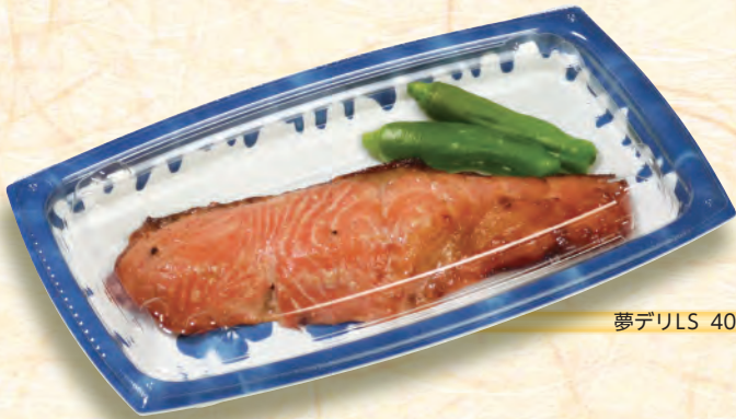
うめ 夢デリLS 40【梅】