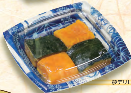
てあお 夢デリLS 5【手まり青】