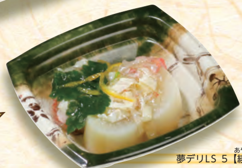
あやおりべ 夢デリLS 5【綾織部】