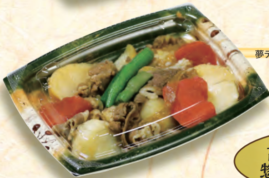
あやおりべ 夢デリLS 15【綾織部】