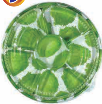
◆ オーダブルS : 6仕切り (3~4人分)