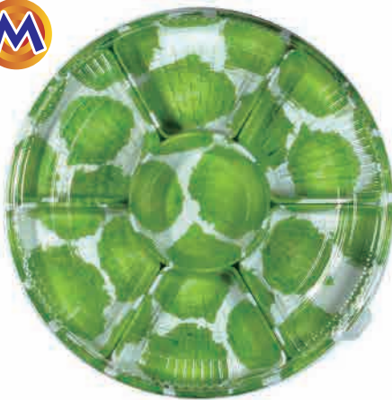
◆ オーダブルM : 7仕切り (5~7人分)