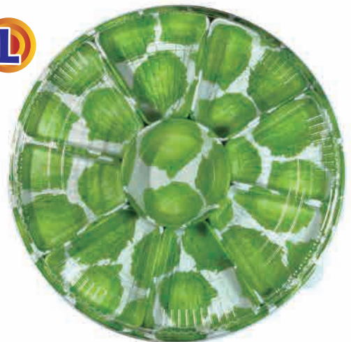
◆ オーダブルL : 9仕切り (8~10人分)