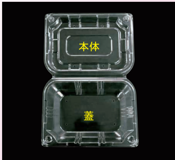
①蓋側を手前に置きます