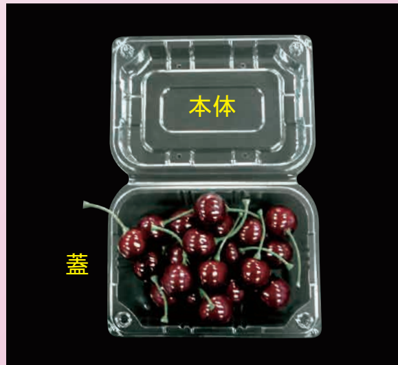
②チェリーを蓋側に入れます