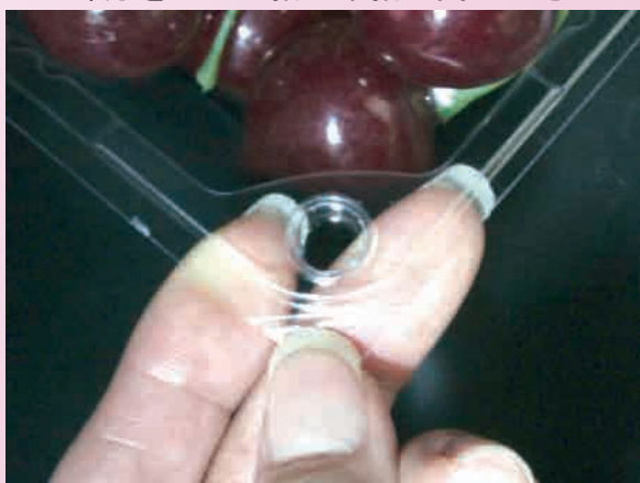
③蓋側を下にしたまま、プッチン嵌合の凸部分を人差し指と中指の間にはさみます